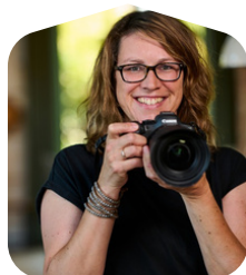
Nathalie Styling en Fotografie