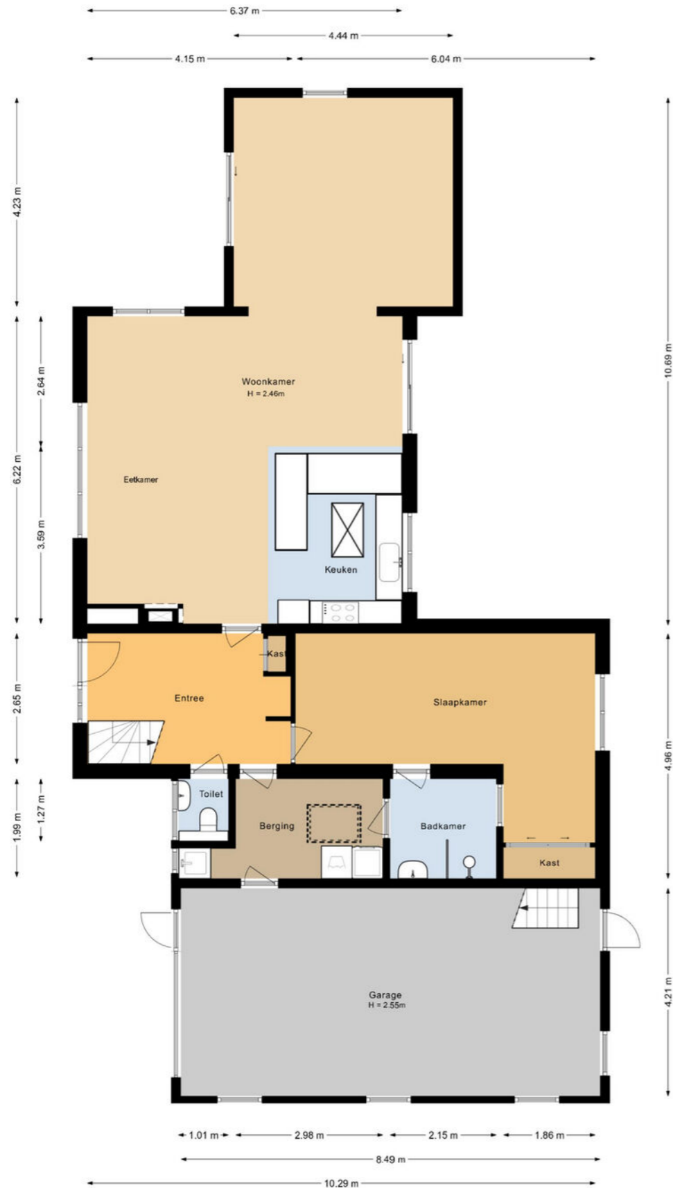
Westeinde 358 De Goorn Begane grond

De plattegronden zijn geproduceerd voor promotionele doeleinden en ter indicatie. Aan deze plattegrond kunnen geen rechten worden ontleend.