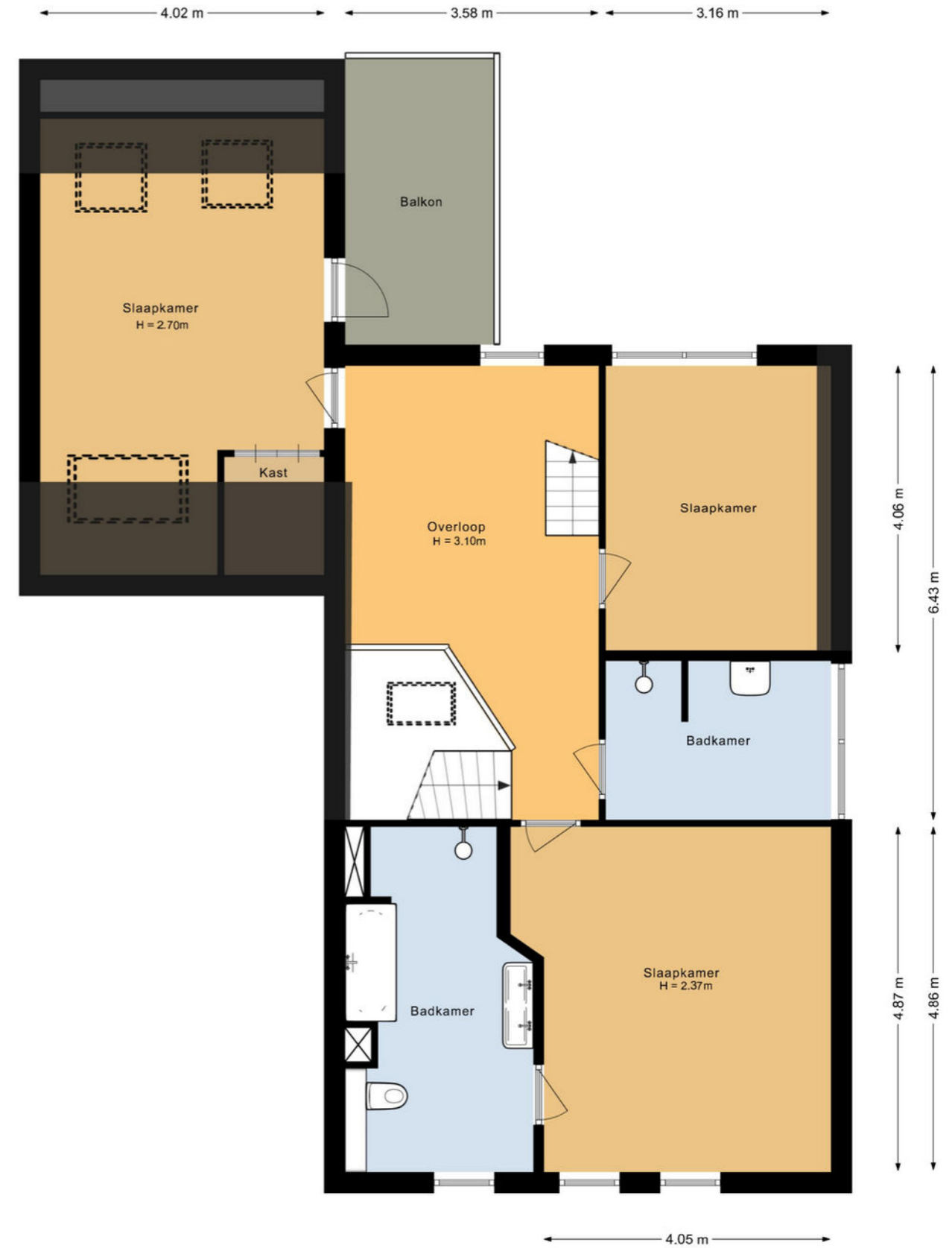
Oosthuizenweg 48 Noordbeemster Eerste verdieping

De plattegronden zijn geproduceerd voor promotionele doeleinden en ter indicatie. Aan deze plattegrond kunnen geen rechten worden ontleend.