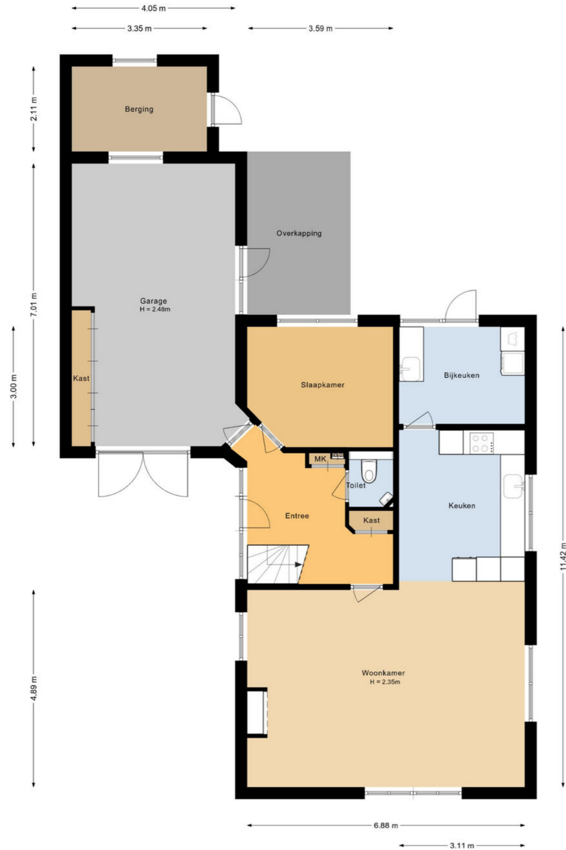
Oosthuizenweg 48 Noordbeemster Begane grond

De plattegronden zijn geproduceerd voor promotionele doeleinden en ter indicatie. Aan deze plattegrond kunnen geen rechten worden ontleend.