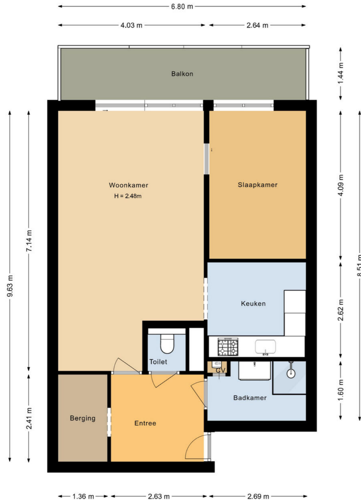
De Roerdomp 87 Purmerend Appartement

De plattegronden zijn geproduceerd voor promotionele doeleinden en ter indicatie. Aan deze plattegrond kunnen geen rechten worden ontleend.