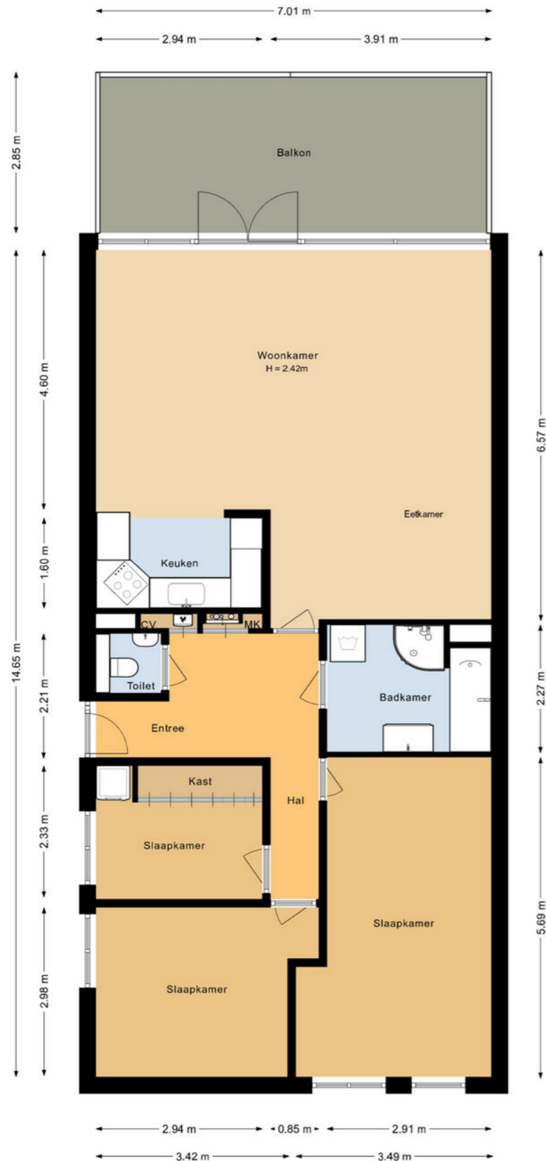
Veersemeer 58 Purmerend Appartement

De plattegronden zijn geproduceerd voor promotionele doeleinden en ter indicatie. Aan deze plattegrond kunnen geen rechten worden ontleend.