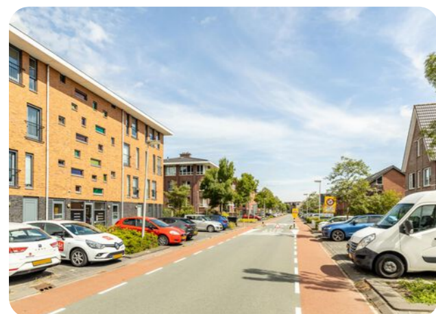
Nijlstraat 154 Purmerend Appartement

De plattegronden zijn geproduceerd voor promotionele doeleinden en ter indicatie. Aan deze plattegrond kunnen geen rechten worden ontleend.