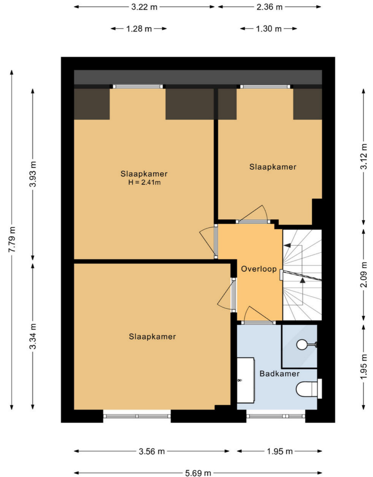
Zwaansvliet 6 Middenbeemster Eerste verdieping

De plattegronden zijn geproduceerd voor promotionele doeleinden en ter indicatie. Aan deze plattegrond kunnen geen rechten worden ontleend.