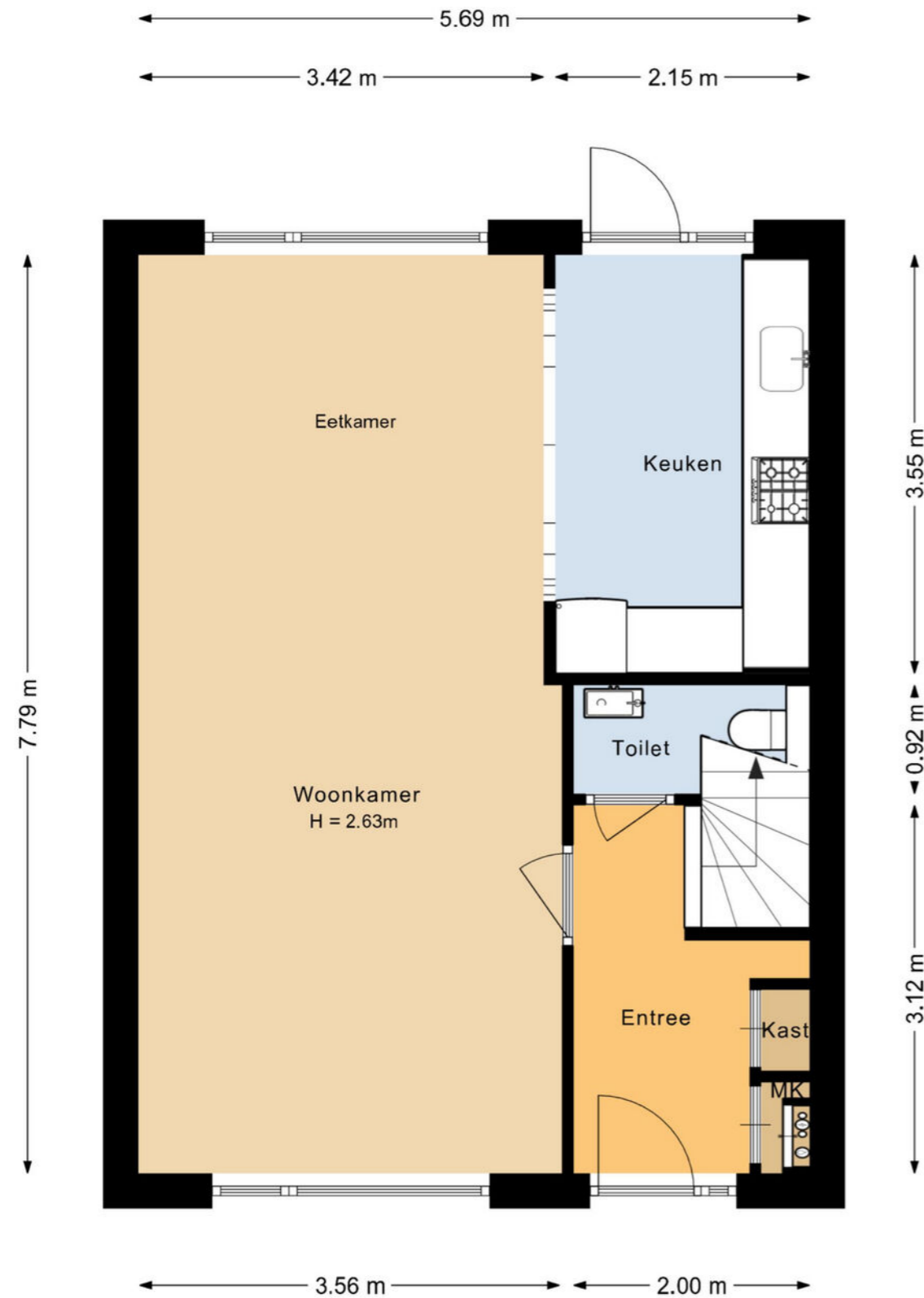
Zwaansvliet 6 Middenbeemster Begane grond

De plattegronden zijn geproduceerd voor promotionele doeleinden en ter indicatie. Aan deze plattegrond kunnen geen rechten worden ontleend.