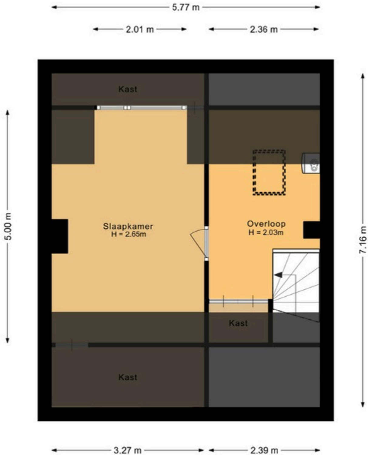
De Tocht 14 1633 HL Avenhorn Tweede verdieping

De plattegronden zijn geproduceerd voor promotionele doeleinden en ter indicatie. Aan deze plattegrond kunnen geen rechten worden ontleend.