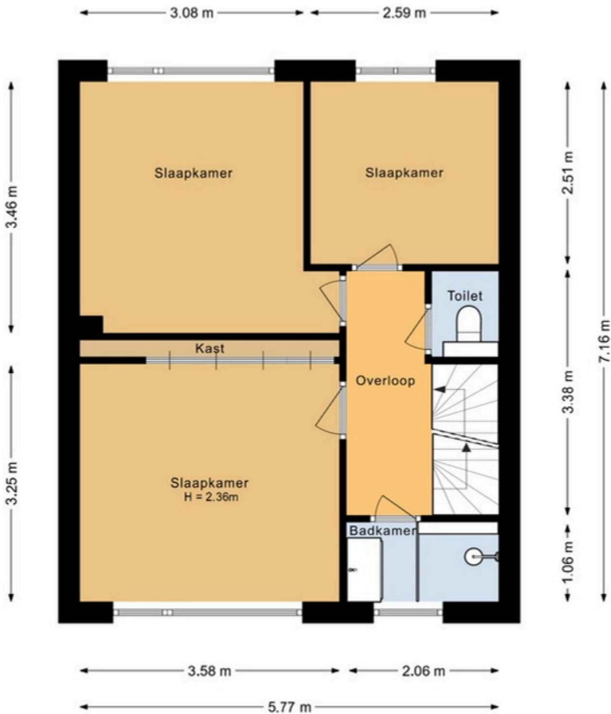
De Tocht 14 1633 HL Avenhorn Eerste verdieping

De plattegronden zijn geproduceerd voor promotionele doeleinden en ter indicatie. Aan deze plattegrond kunnen geen rechten worden ontleend.