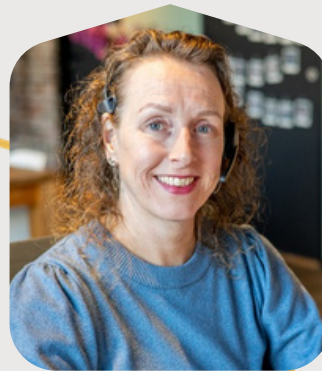
Evelien Klantsupport wonen