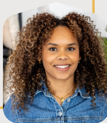
Gioya Assistent- makelaar